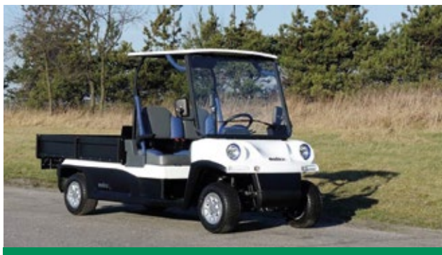
El Melex 465 ofrece una zona de carga generosa para aquellas tareas que requieran un poco más de capacidad a nuestro vehículo