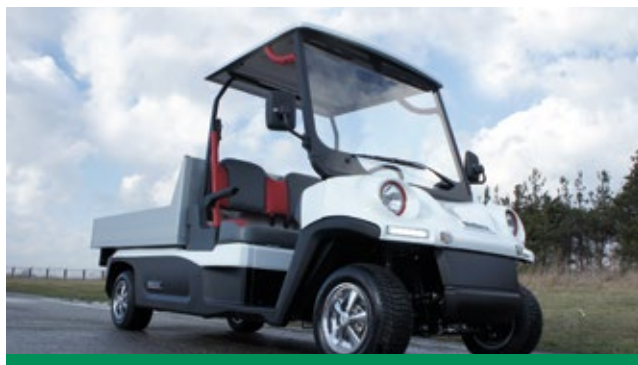
La versión homologable del Melex 465 puede operar, también, en la vía pública, ampliando su abanico de posibilidades.